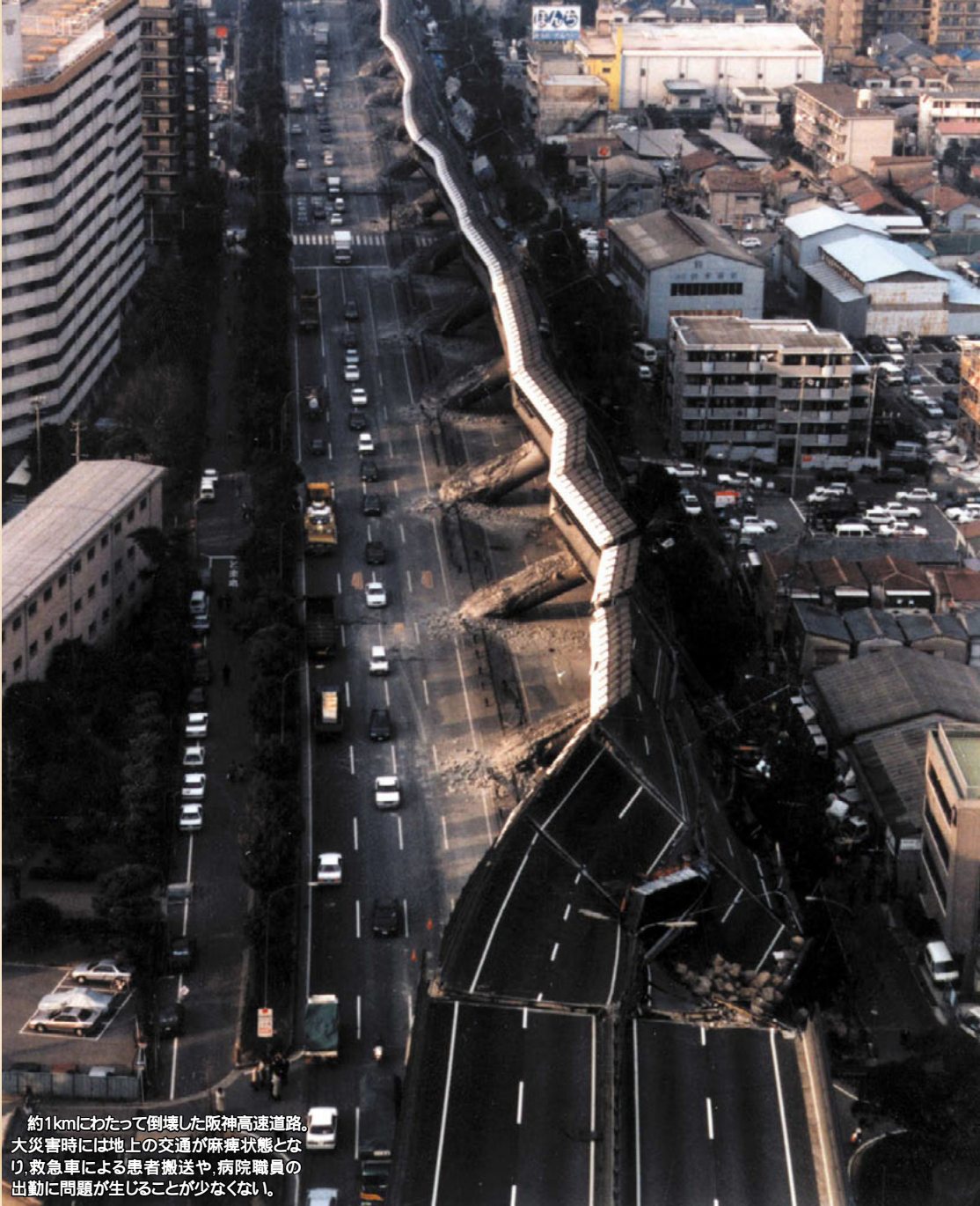
約1kmにわたって倒壊した阪神高速道路。 大災害時には地上の交通が麻痺状態とな り、救急車による患者搬送や、病院職員の 出勤に問題が生じることが少なくない。