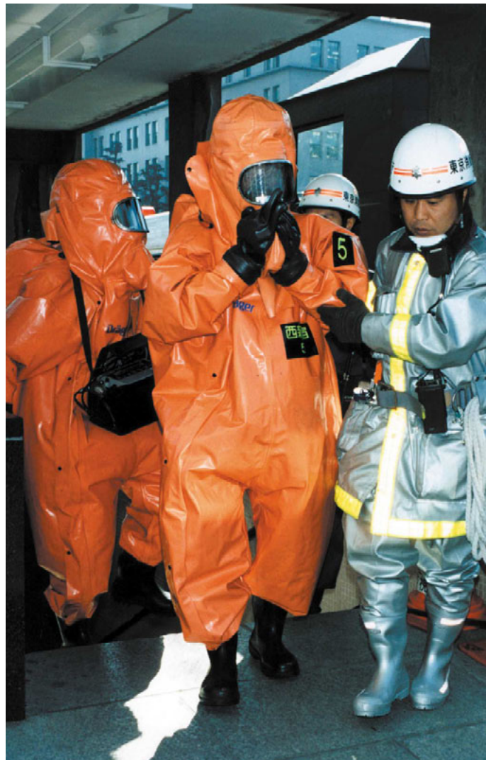
図2 化学災害情報提供シート