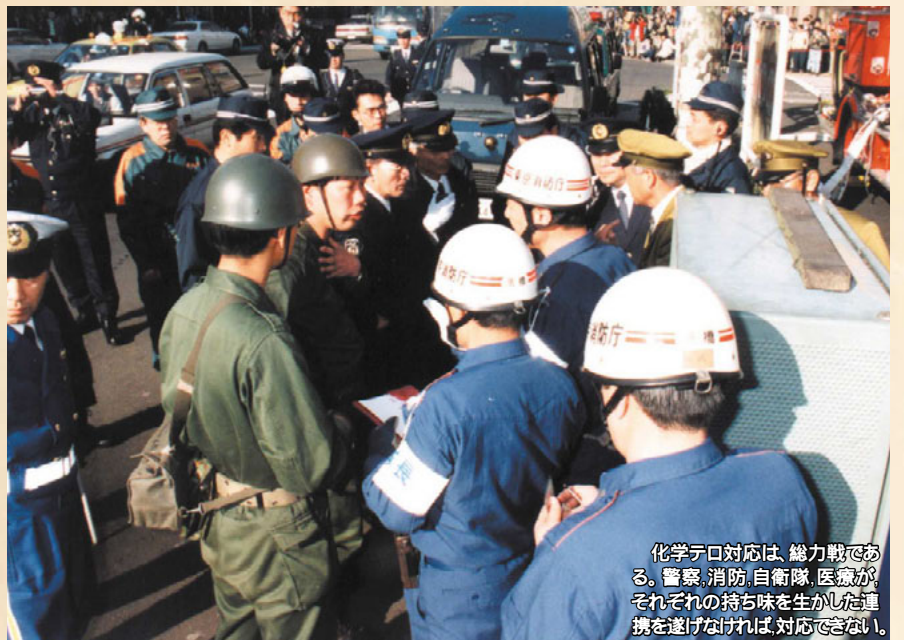
化学テロ対応は、総力戦である。警察、消防、自衛隊、医療がそれぞれの持ち味を生かした連携を遂げなければ、対応できない。