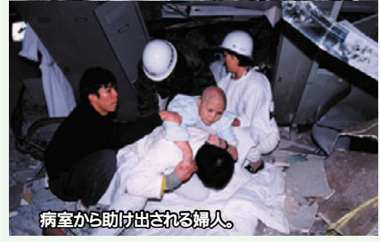
5階部分が崩壊した神戸市西市民病院。大震災下では、病院施設・職員が被災することが前提となる。