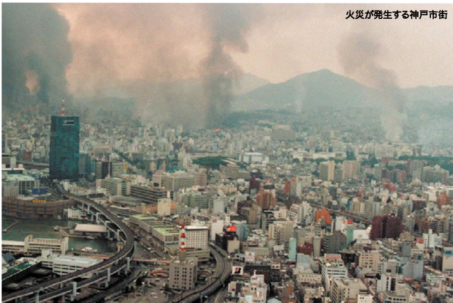
火災が発生する神戸市街