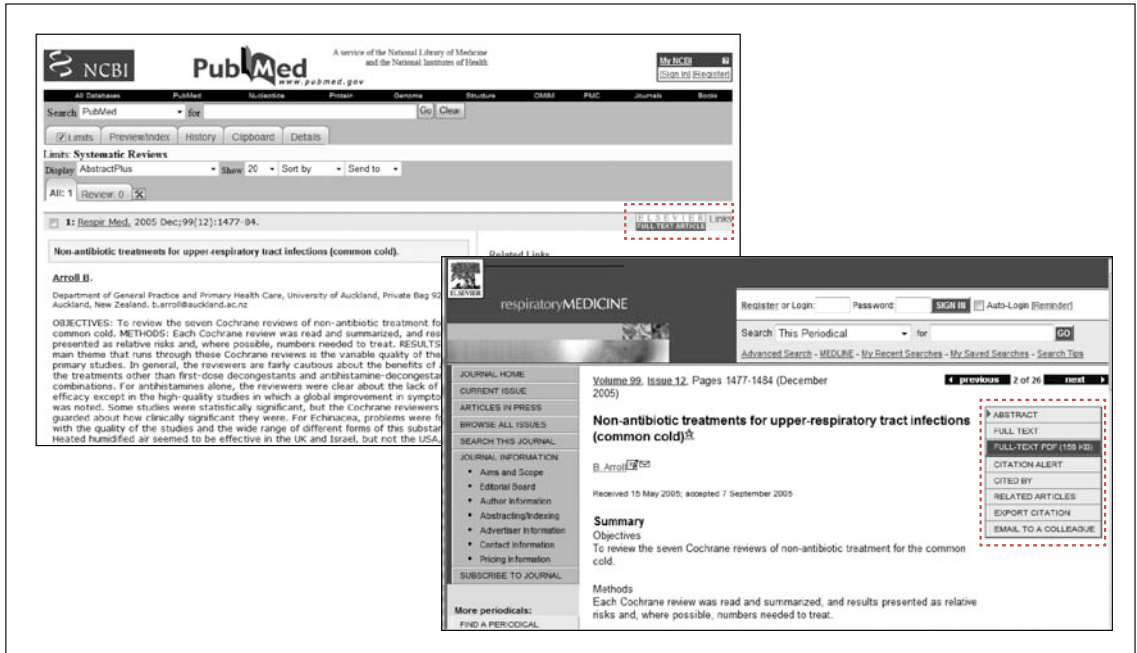
図 11-19 電子論文の取得