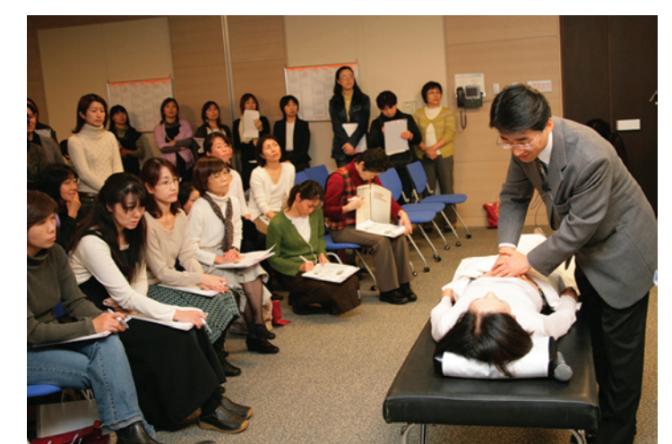
● セミナー会場（医学書院本社）

弊社を会場に、看護師を対象とする臨床技術のスキルアップに役立つセミナーを実施。貴社製品に対する理解を参加者にダイレクトに訴求できます。また、事後の再録記事を通じて、当日来場できなかった読者に対してもエッセンスを伝えることができます。