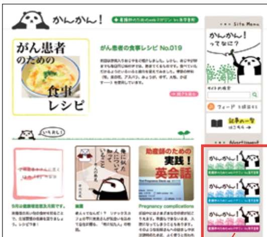
バナー広告はこちらに掲載されます。