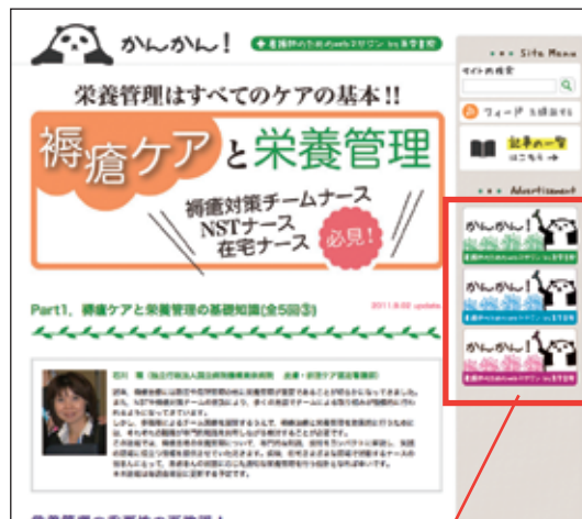
バナー広告はこちらに掲載されます。